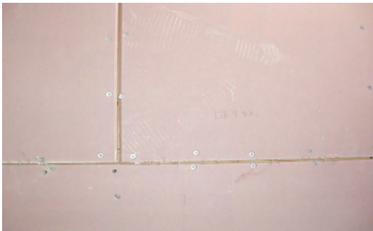
写真右上を張替え