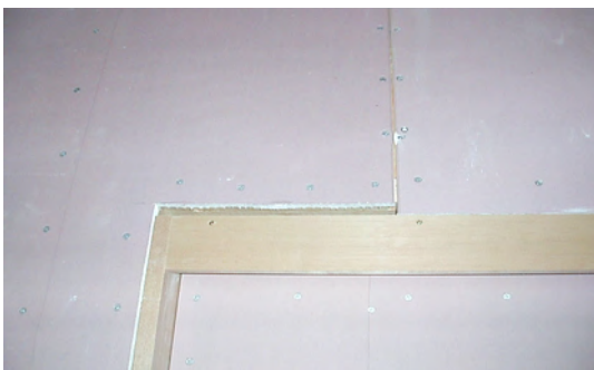
左のボード張替え